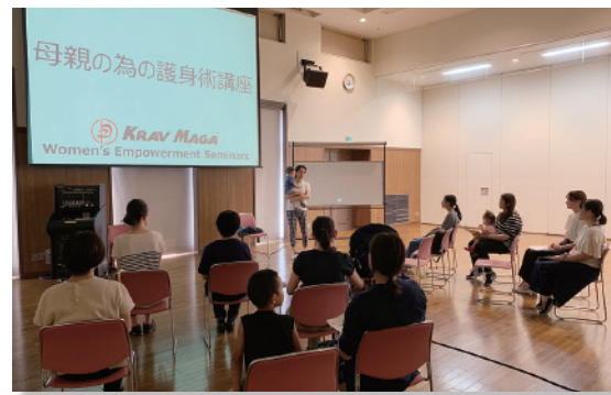
格闘技ジムの協力で行なった護身術セミナー

また、議会では子どもの権利条約に則し、いじめ・虐待・体罰などあらゆる暴力から子どもの人権を守ることを最優先に活動。都内23区における児童相談所設置を見据え、都内の