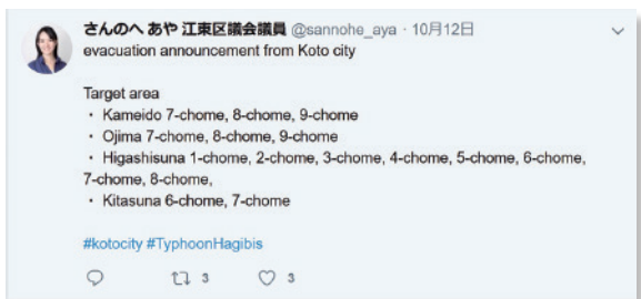
Twitterを使った情報発信。外国人への対応も課題の一つ

江東区では大きな被害が出ずにすみました。区としての対応の不備を感じる場面が多々ありました。特に、警戒レベル3の事前避難がなく突然の警戒レベル4避難勧告発令であったこと（江戸川区の発令と比べて約5時間遅れ）、防災無線が聞こえなかった、ペット連れ世帯の受入れ等で避難所での対応にばらつきがあったことなど、改善に向けて取り組んでまいります。また、江東区在住の外国人3万人に対し外国語対