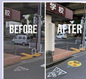
旧標識の前に増設された新たな標識

子どもの死亡事故の中でも上位を占めている交通事故。横断防止柵や路面標識の設置等の対策を進めています。写真は塩浜二丁目付近の通学路。自転車と歩行者の出会い頭の衝突を防ぐため、標識がより目に付きやすいように区に働きかけました。危ないな、怖いなど感じる場所がありましたら、お気軽にご相談ください。