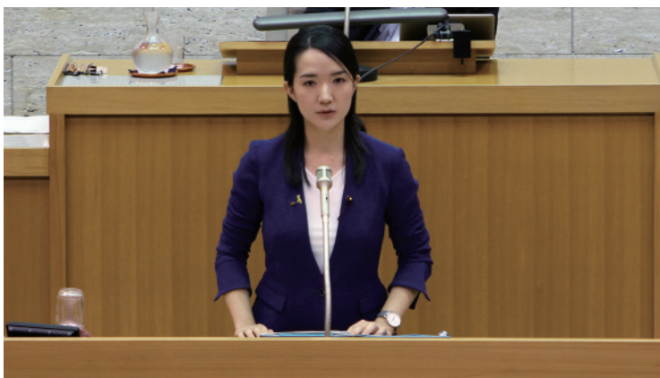
9月20日の江東区本会議でも行財政などについて質問しました

議員になって驚いたのが費用弁償（地方議会の議員が議会や委員会などに出席した際に支払われる旅費）の存在です。江東区議会では議員に毎回、費用弁償として東京23区内で一番高い3,000円/1日が支払われます。民間企業では考えられない実費以上の旅費を受け取ることに違和感を覚えました。7月29日に議長と議員全員に対して「江東区議会