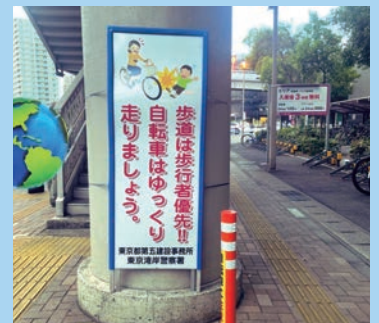
歩道橋付近における歩行者と自転車の衝突を回避するため看板とポールを設置して頂きました!