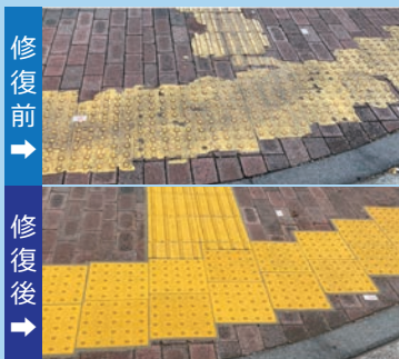
東陽町付近の点字ブロックが剥がれていた箇所を修復して頂きました!