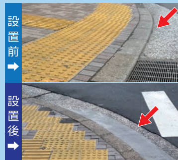
東雲付近において、車椅子やベビーカーがつかまってしまう横断歩道の段差を解消して頂きました!