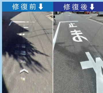
区民の方より路面標示が薄くなっているご報告を受け書き直し対応をして頂きました!